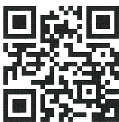
เว็บไซต์กองทุนพัฒนาไฟฟ้า

ทั้งนี้ สามารถดาวน์โหลดแบบฟอร์มประกอบการดำเนินงานต่างๆ ผ่านเว็บไซต์กองทุนพัฒนาไฟฟ้า https://pdf.erc.or.th/ หรือ QR Code ด้านล่างนี้ ๕