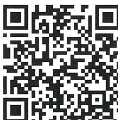
กฎหมายที่เกี่ยวข้อง